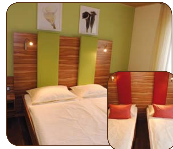
Das Doppelzimmer gibt es auch mit zwei einzelnen Betten.