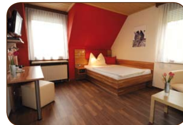
Das Single-Bett mit 1,40-Meter-Breite bietet Platz zum Erholen.

Die im Frühjahr 2010 renovierten Comfort-Zimmer sind zur Passage gelegen. Sie bieten Ihnen zusätzlich zur Standard-Ausstattung einen 26-Zoll-Flatscreen-TV mit digitalen Kanälen und einen DVD-Player. Auch an Kleinigkeiten wie höhenverstellbare Lattenroste und Kosmetikspiegel haben wir gedacht.